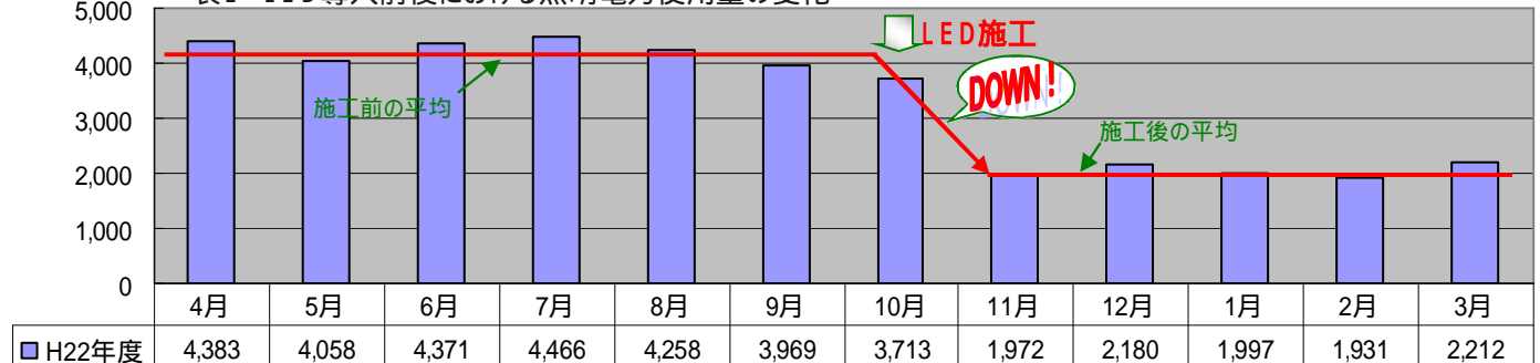
表2 LED導入前後における照明電力使用量の変化 単位:kWh